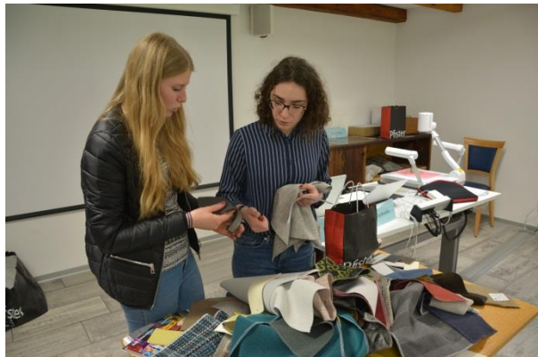
« Quelle matériau va le mieux avec notre style ? », se demandent les apprenants.

du coton ou des duvets d'eider. Ce sont des matériaux de rembourrage pour couvertures, coussins et certains matelas que les futurs professionnels doivent reconnaître à l'aveugle.