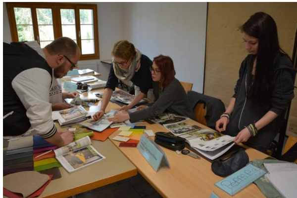
Lors du travail en groupe, les apprenants découpent des exemples de divers designs dans des revues.