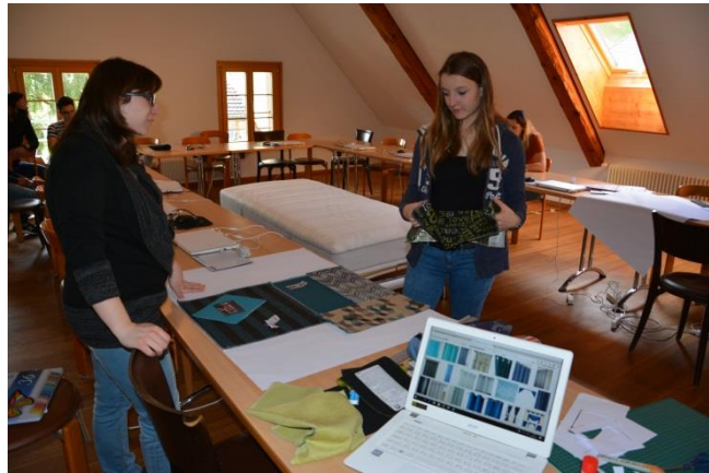
« Quelle matériau va le mieux avec notre style ? », se demandent les apprenants.

même couleur », dit une apprenante à son collègue. Les futurs professionnels semblent se réjouir de ce travail créatif. « Oui, ça nous plaît. C'est du design », commente un apprenant. Les futurs gestionnaires du commerce de détail ont dorénavant aussi la possibilité d'utiliser des ordinateurs portables modernes durant les CIE. Ainsi cherchent-ils certains designs et exemples dont ils ont besoin pour le travail en groupe, aussi sur les sites web du commerce de meubles.