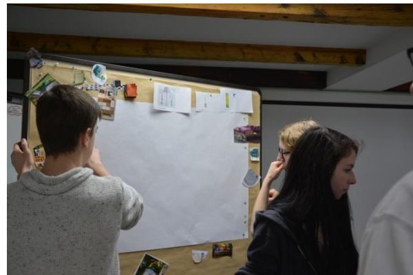
Ici naissent des collages des styles différents.