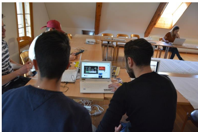
Dans les CIE, les apprenants utilisent désormais aussi des ordinateurs portables.

découpent des exemples dans des revues, cherchent des matériaux adaptés à leur style et font du « Moodboard » sous forme d'un collage un important outil de présentation qui les aidera dans le conseil aux clients.